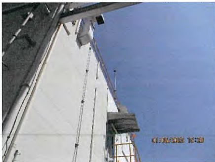
ภาพที่ 2.2-50 ติดตั้งสายล่อฟ้าตามมาตรฐานฯ