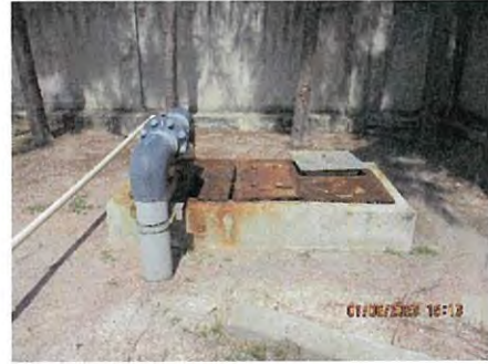
ภาพที่ 2.2-8 ถังรวบรวมน้ำเสีย Waste Water Inspection Pit (V89-N)