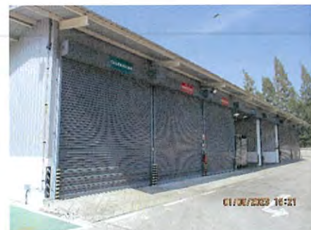
ภาพที่ 2.2-23 พื้นที่สำหรับจัดเก็บกากของเสีย