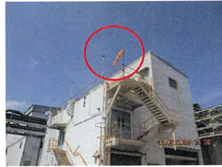
ภาพที่ 2.2-35 ถังลมบอกทิศทางลม