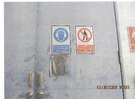
ภาพที่ 2.2-39 ป้ายเตือนอันตรายพื้นที่ ที่ต้องขออนุญาตเข้าทำงาน