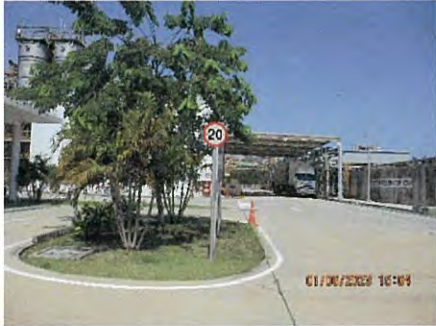
ภาพที่ 2.2-18 ป้ายจำกัดความเร็ว 20 กิโลเมตร/ชั่วโมง ภายในพื้นที่โครงการ