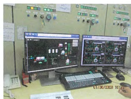
ภาพที่ 2.2-33 ติดตั้งอุปกรณ์ Level Switch