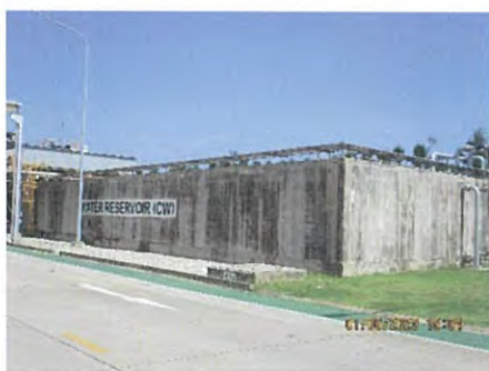
ภาพที่ 2.2-32 บ่อน้ำสำรองขนาด 1,200 ลูกบาศก์เมตร