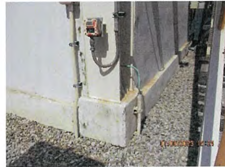
ภาพที่ 2.2-49 ติดตั้งสายกราวด์ลงดินตามมาตรฐานฯ