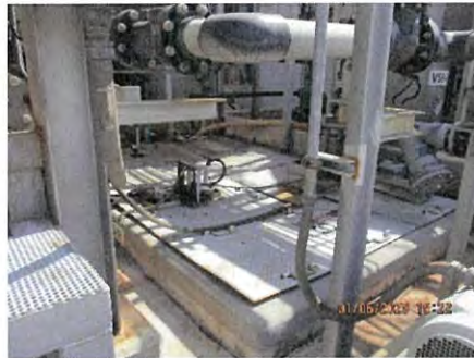
ภาพที่ 2.2-9 ถัง Waste Water Inspection Pit (V96-N)