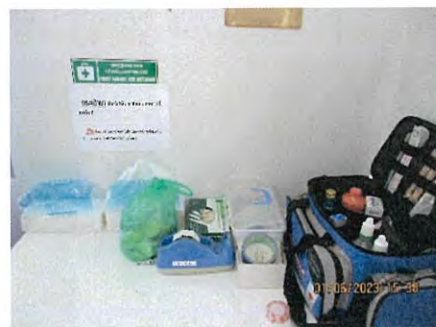
ภาพที่ 2.2-30 ห้องปฐมพยาบาล อุปกรณ์ปฐมพยาบาล และเวชภัณฑ์