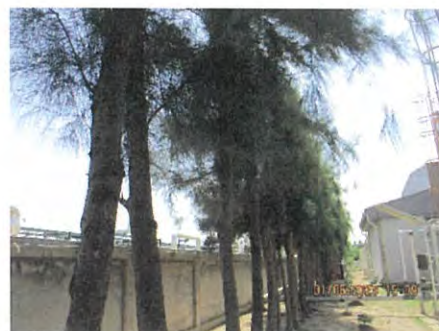
ภาพที่ 2.2-44 พื้นที่โล่งโดยรอบแนวการวางท่อ