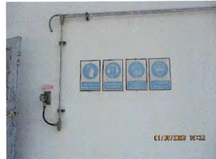
ภาพที่ 2.2-29 ป้ายเตือนการสวมใส่อุปกรณ์ป้องกันอันตรายส่วนบุคคล