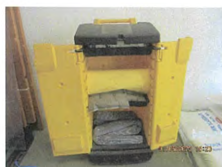
ภาพที่ 2.2-46 อุปกรณ์ควบคุมกรณีสารเคมีหกรั่วไหล