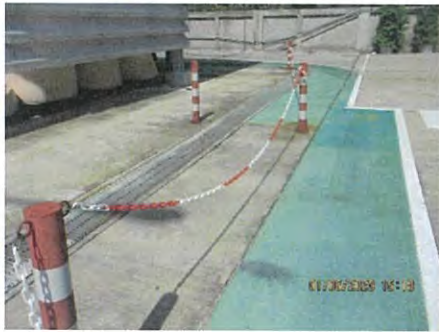
ภาพที่ 2.2-41 สิ่งก่อสร้าง (Barrier) ป้องกันการเกิดอุบัติเหตุจากยานพาหนะ