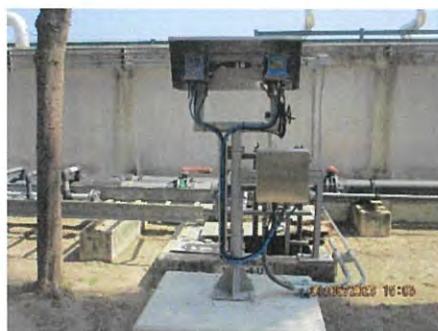
Inspection Pit (V100-4-U)