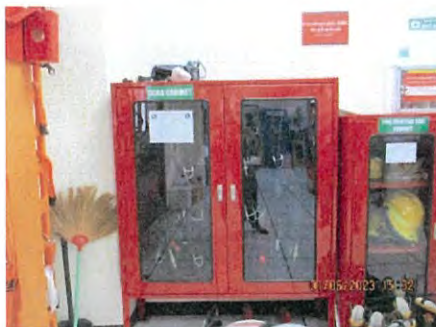
ภาพที่ 2.2-52 อุปกรณ์เครื่องช่วยหายใจและ หน้ากากป้องกันแก๊สพิษ