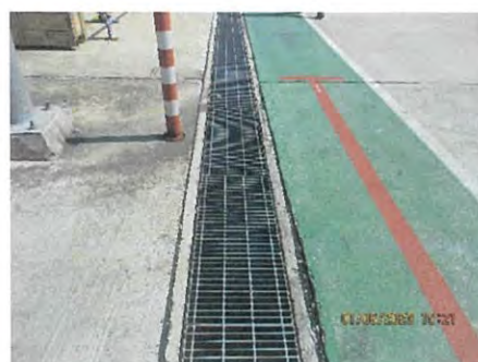
ภาพที่ 2.2-17 รางระบายน้ำฝนภายในโครงการ