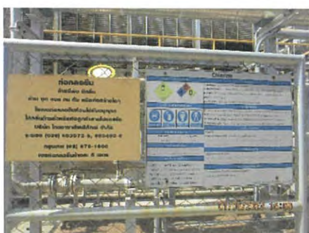
ภาพที่ 2.2-45 ป้ายสัญลักษณ์ ข้อความเตือนบริเวณแนวท่อ