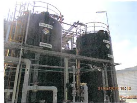
ภาพที่ 2.2-11 HCL Storage Tank