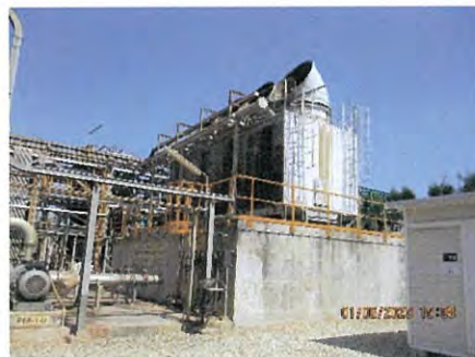
ภาพที่ 2.2-12 หอผลิตน้ำหล่อเย็น (Cooling Water Blow down)