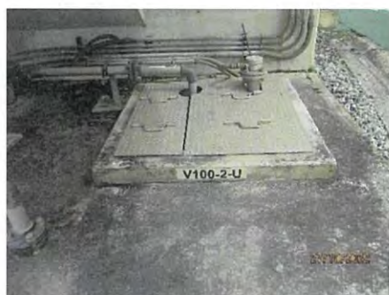
Inspection Pit (V100-2-U)