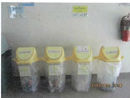
ภาพที่ 2.2-24 ภาชนะแยกตามประเภทของมูลฝอย