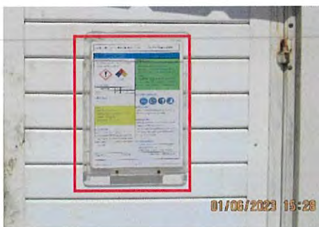
ภาพที่ 2.2-22 ข้อมูลความปลอดภัยในการทำงาน เกี่ยวกับสารเคมี