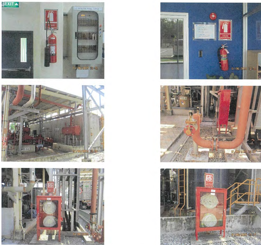
ภาพที่ 2.2-31 ระบบป้องกันและระงับอัคคีภัย