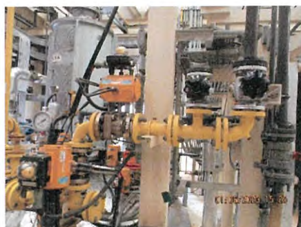
ภาพที่ 2.2-40 อุปกรณ์ตรวจสอบและป้องกันการรั่วไหลของก๊าซคลอรีน