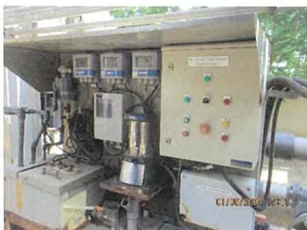
ภาพที่ 2.2-14 เครื่องมือวิเคราะห์อย่างต่อเนื่อง (Online-Analyzer)