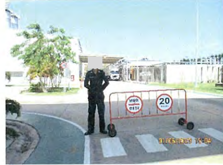
ภาพที่ 2.2-19 เจ้าหน้าที่บริเวณจุดตรวจผ่านเข้า-ออก