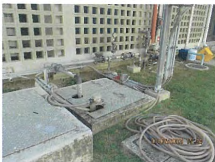
Inspection Pit (V100-1-U)