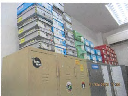
ภาพที่ 2.2-27 อุปกรณ์ป้องกันอันตรายส่วนบุคคล (PPE) พื้นฐาน สำหรับพนักงาน