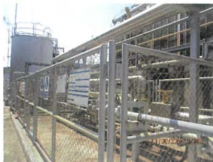
ภาพที่ 2.2-43 การปิดกั้นพื้นที่ตลอดแนวการวางท่อ