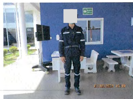
ภาพที่ 2.2-38 พนักงานสวมอุปกรณ์ป้องกัน ความปลอดภัย (PPE)