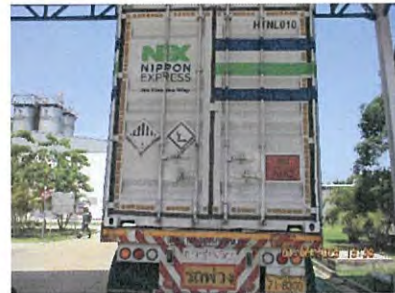
ภาพที่ 2.2-21 รายละเอียดบนตัวรถที่บรรทุกสารเคมี/ ผลิตภัณฑ์