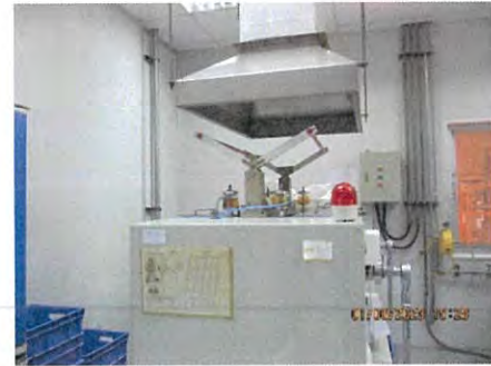
ภาพที่ 2.2-51 ภาพการติดตั้งระบบป้องกันไอสารเคมี (Filter)