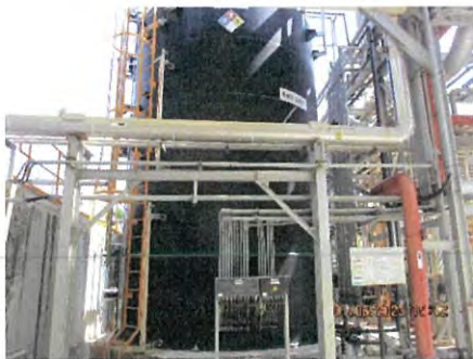
ภาพที่ 2.2-10 TDS Tank