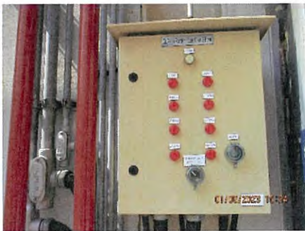
ภาพที่ 2.2-48 ระบบตรวจจับ