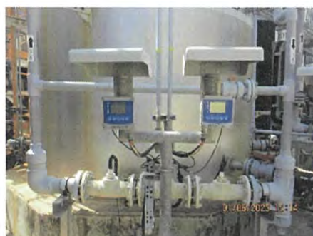
ภาพที่ 2.2-15 อุปกรณ์ ORP Sensor