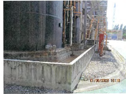
ภาพที่ 2.2-37 คันกัน (Dike) คอนกรีตล้อมรอบ ถังเก็บสารเคมีบริเวณถัง