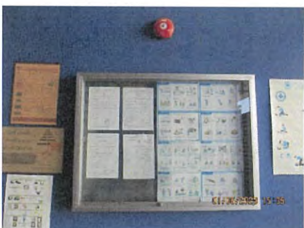
ภาพที่ 2.2-26 บอร์ดประชาสัมพันธ์เกี่ยวกับการดำเนินงานด้านความปลอดภัย