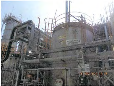
ภาพที่ 2.2-7 บ่อปรับสภาพให้เป็นกลาง (Neutralization)