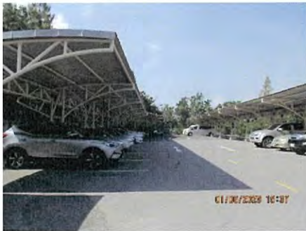
ภาพที่ 2.2-20 พื้นที่จอดรถ และพื้นที่จอดรถ