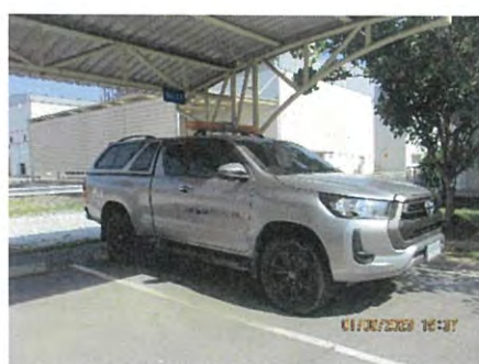
ภาพที่ 2.2-28 พาหนะสำรองกรณีฉุกเฉิน