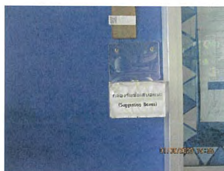
ภาพที่ 2.2-25 กล่องรับเรื่องร้องเรียน