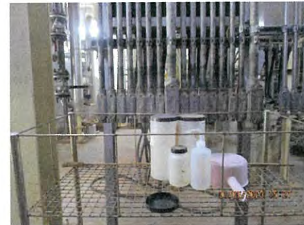
ภาพที่ 2.2-53 ถาดรองรับการระบายของเหลว