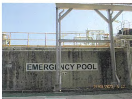
ภาพที่ 2.2-16 บ่อพักน้ำฉุกเฉินขนาด 1,500 ลูกบาศก์เมตร