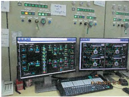
ภาพที่ 2.2-34 หน้าจอ DCS