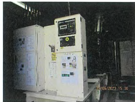
ภาพที่ 2.2-42 แหล่งพลังงานสำรอง (Back up Electrical Generator)