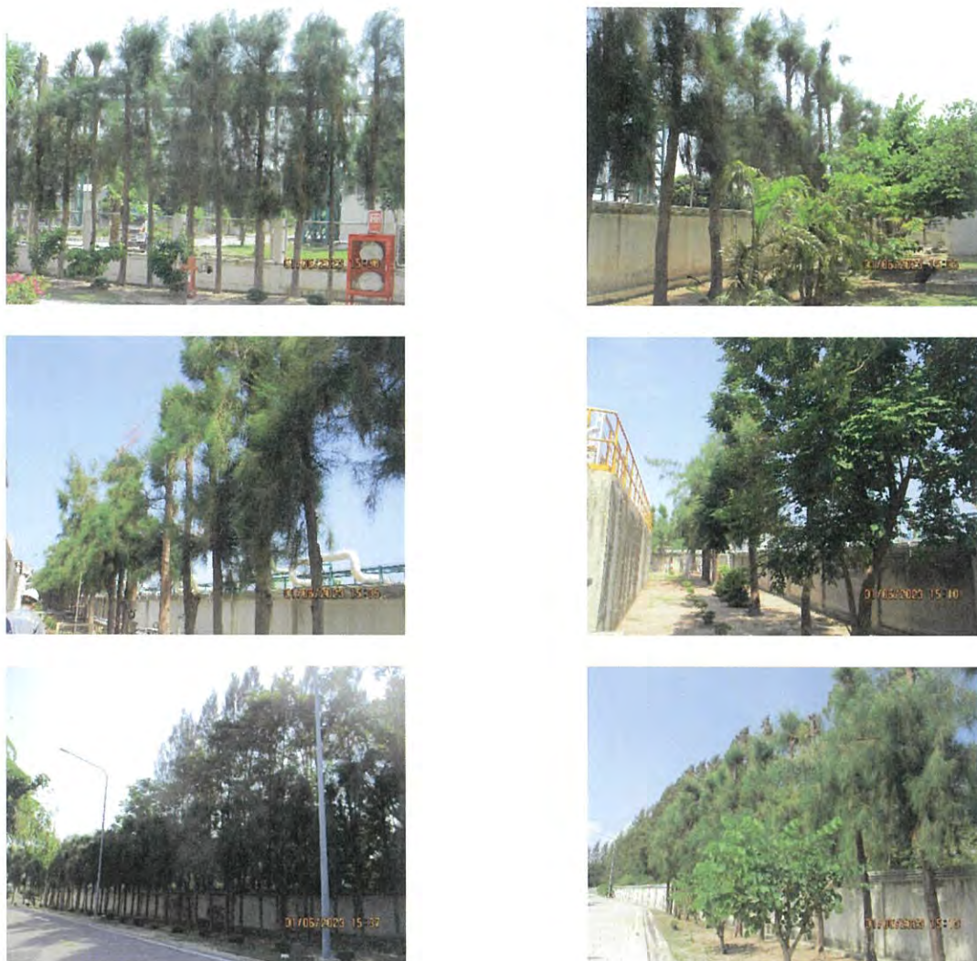
ภาพที่ 2.2-54 พื้นที่สีเขียวและแนวกันชน